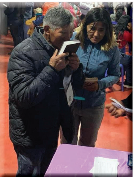
¡Nuevo convertido recibe y besa su nueva Biblia!